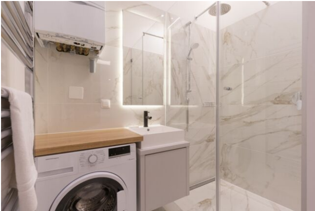
Badezimmer - Waschmaschine