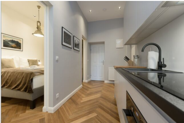
Küche - Schlafzimmer